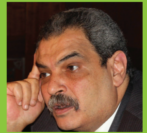
بقلم أ.د. مصطفى كامل مدير مركز بازل، وزير البيئة الأسبق

أصبح العالم في حاجة ملحة لوجود منظومة فعالة لإدارة البيئة السليمة للمخلفات والنفايات الخطرة وهنا برزت أهمية نقل التكنولوجيا للدول العربية للمساعدة في تطبيق أحكام اتفاقيه بازل بهدف التحكم في النقل الآمن للمخلفات الخطرة عبر الحدود .