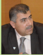
د. أولادلي أوزيبانجا مدير مركز تنسيق اتفافية بازل لمنطقة أفريقيا.