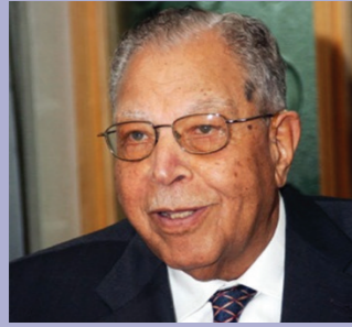
مصطفى كمال طلبه