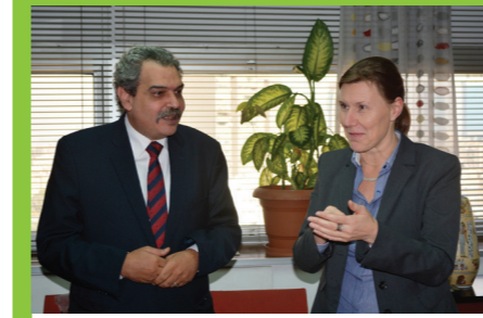
مدير مركز بازل في لقاء مع السيدة تابيننا كازاكوسكي ممثلة الخارجية الفنلندية أثناء مناقشة أنشطة المشروع الممول من الحكومة الفنلندية

ورشة العمل الإقليمية حول الإدارة السليمة بيئيا للمواد الكيميائية والنفايات الخطرة وآلية تبادل المعلومات لدعم أوجه التآزر بين إتفاقيات بازل وروتردام وستوكهولم في البلدان العربية. شرم الشيخ، ٧-٩ ديسمبر ٢٠١٥. الدورة التدريبية الإقليمية عن تقييم مخاطر المبيدات على الإنسان والبيئة ٢ أبريل ٢٠١٥ الإسكندرية - مصر. الدورة التدريبية الإقليمية عن ادارة التخلص من نفايات المبيدات للدول العربية ٣١ مارس-١ أبريل ٢٠١٥، الإسكندرية - مصر. ورشة العمل الإقليمية للإدارة السليمة بيئيا للملوثات العضوية الثابتة ٣٠ مارس ٢٠١٥ الإسكندرية - مصر. ورشة العمل الإقليمية للإدارة السليمة بيئيا لمركبات ثنائي الفينيل متعدد الكلور (PCBs) ٢٩ مارس ٢٠١٥